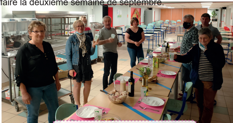
Repas de convivialité à la MFR de Vercel

action est double : répondre au Plan Alimentaire Territorial (PAT) et prévenir des risques ayant un impact sur la santé. Les participants aimeraient que cet événement puisse se faire la deuxième semaine de septembre.