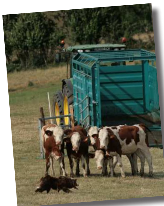
Le chien pousse les bovins dans la bétailière