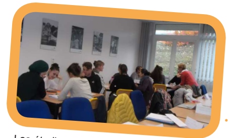
Les étudiants préparent leur future action de prévention

Rendez-vous donc à l'automne 2020 avec les nouveaux délégués !