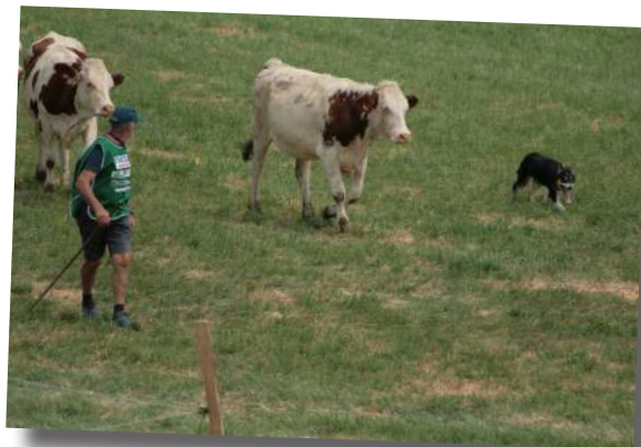
Le chien au travail évitant que le troupeau ne s'éclate

Devant le succès de la première édition, il est déjà convenu de renouveler le concours l'année prochaine mais cette fois-ci, ce sera la Finlande qui l'organisera.