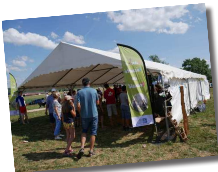
Une belle fréquentation sur le stand MSA