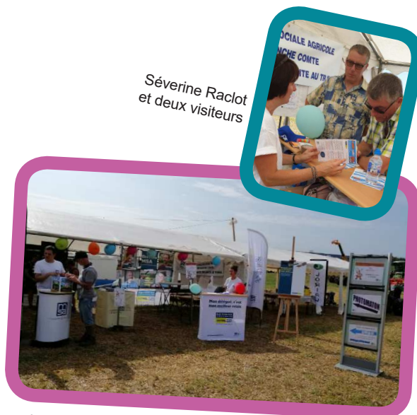
Le stand MSA à la finale de labour