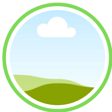
Valérie ETCHEGORRY SAIDI