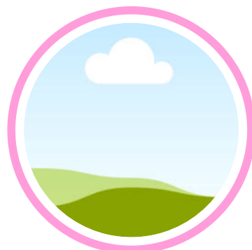
Aurore ROFFAT LABISCARRE