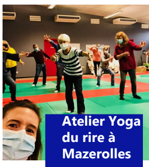
Atelier Yoga du rire à Mazerolles